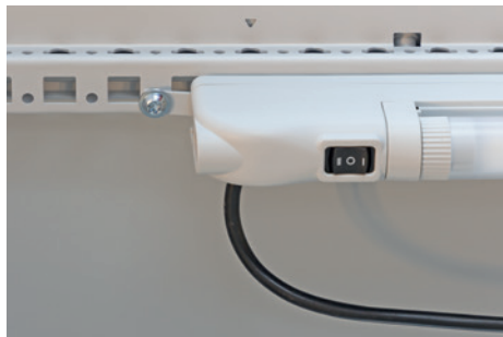
Assembly with screws on profiles and surfaces