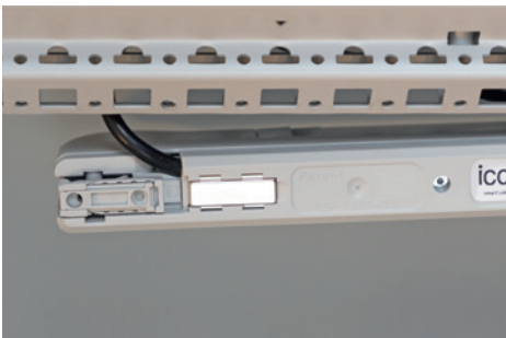
Assembly with integrated magnets