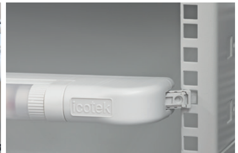
Snap-in assembly in the 19" rack